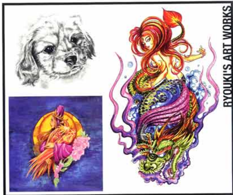
RYOUKI'S ART WORKS